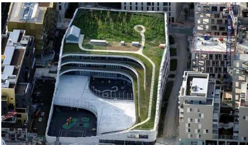
Рисунок 9. Начальная школа, Франция, Париж [10].

содержащую растительность. На сегодняшнее время учебное заведение представляет собой достопримечательность с внутрирастительной средой, защита которой была организована людьми. Здесь дети начальных классов в полной мере смогли почувствовать связь и единение с природой во время учебного процесса, а местные жители - проникнуться инновационными решениями.