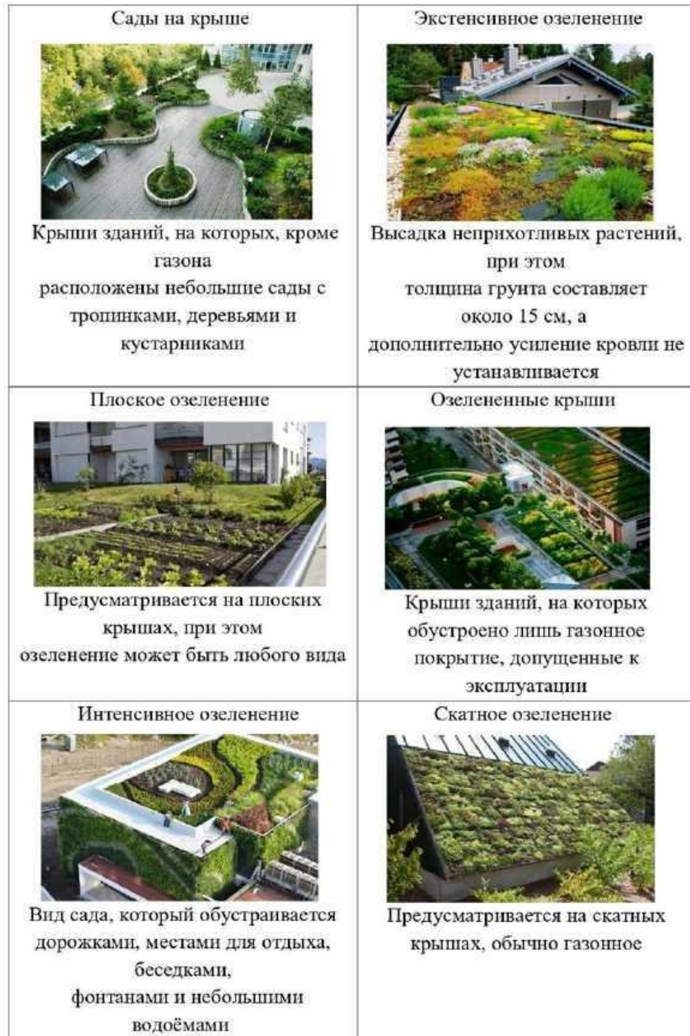
Рисунок 6. Виды оформления кровель с помощью растений [7].

вьющихся растений, способных образовывать лианы длиной в несколько метров из одного ствола. Кроме того, он имеет низкие финансовые расходы и не требует какой-либо подструктуры.