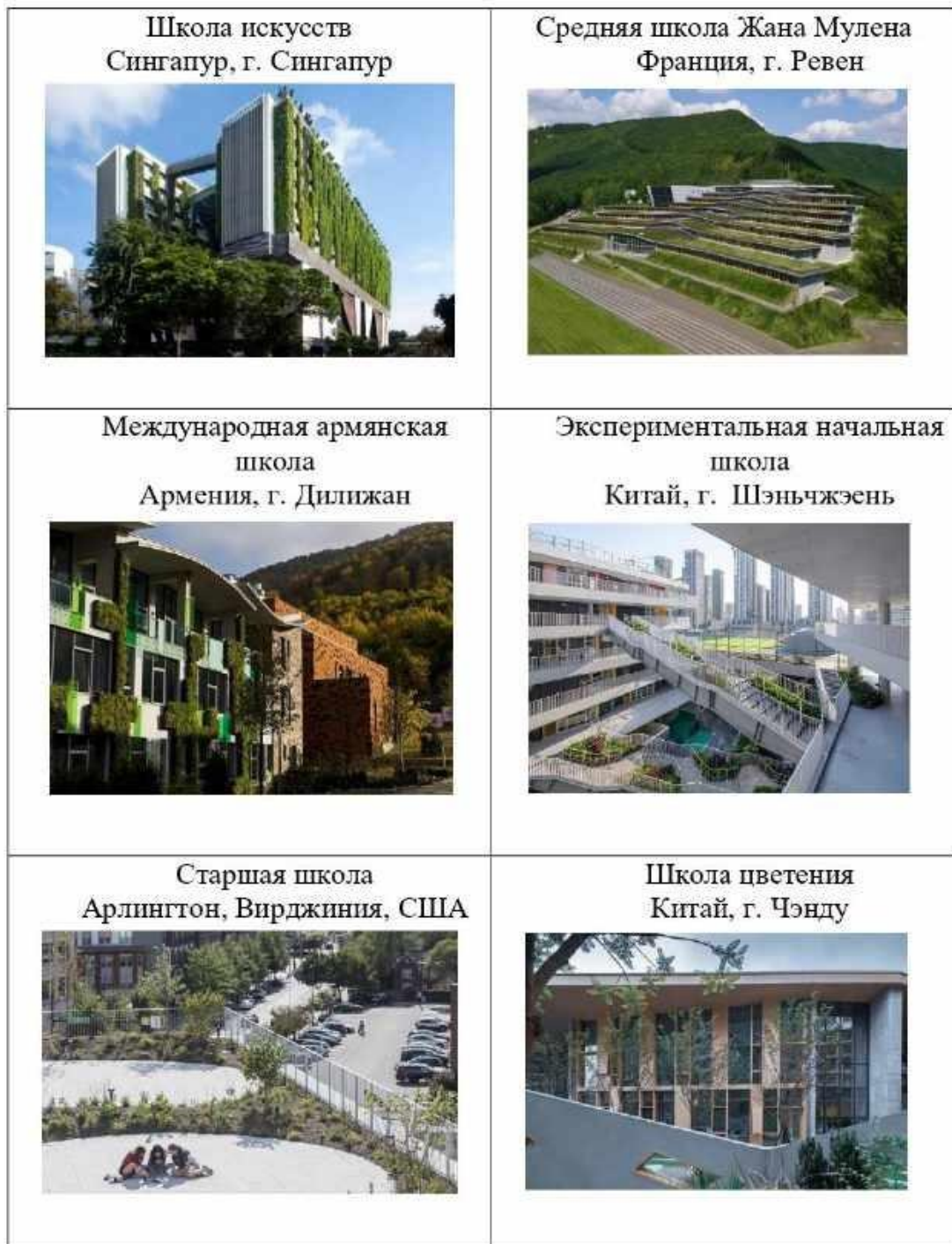
Рисунок 8. Примеры школ мира с зелёным фасадом и кровлями [9].

Кроме уникальной живой крыши, школа также удивляет и наличием живого фасада. Состоит она из бетонных блоков, представляющих собой одну видимую гладкую, отражающую свет сторону, и незаметную на первый взгляд ребристую сторону, собирающую всю дождевую воду и