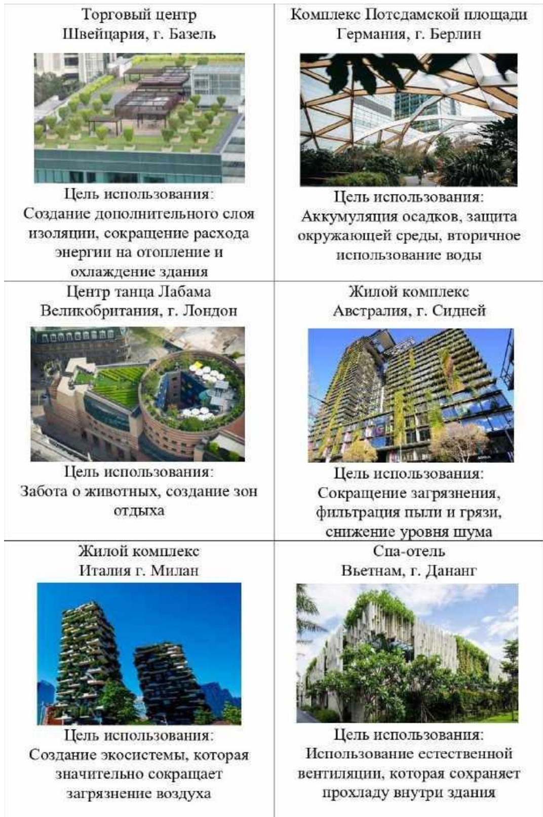
Рисунок 1. Примеры использования зелёных крыш и фасадов зданий в мировой практике [1].