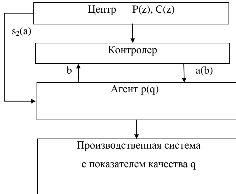
Рис. 3. Схема трехуровневой модели "центр-контролер-агент" управления качеством с учетом возможной коррупции и борьбы с ней.

дачи взятки. Схема трехуровневой модели управления качеством в организационно-экономической системе типа "центр-контролер-агент" с учетом возможной коррупции и борьбы с ней, показана на рис. 3.